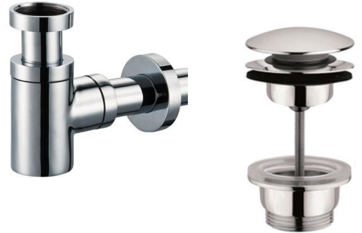
Designbekersifon rond met muurbuis en rozet, chrom en design afvoerplug chrom