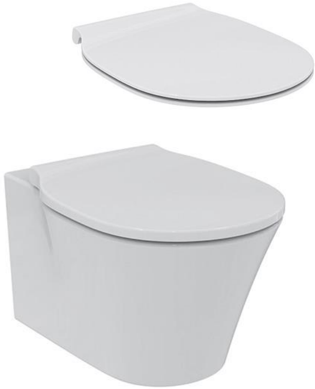
Ideal Standard Wandcloset AquaBlade, diepspoel met met dunne softclosing zitting en deksel met RVS scharnieren, kleur wit