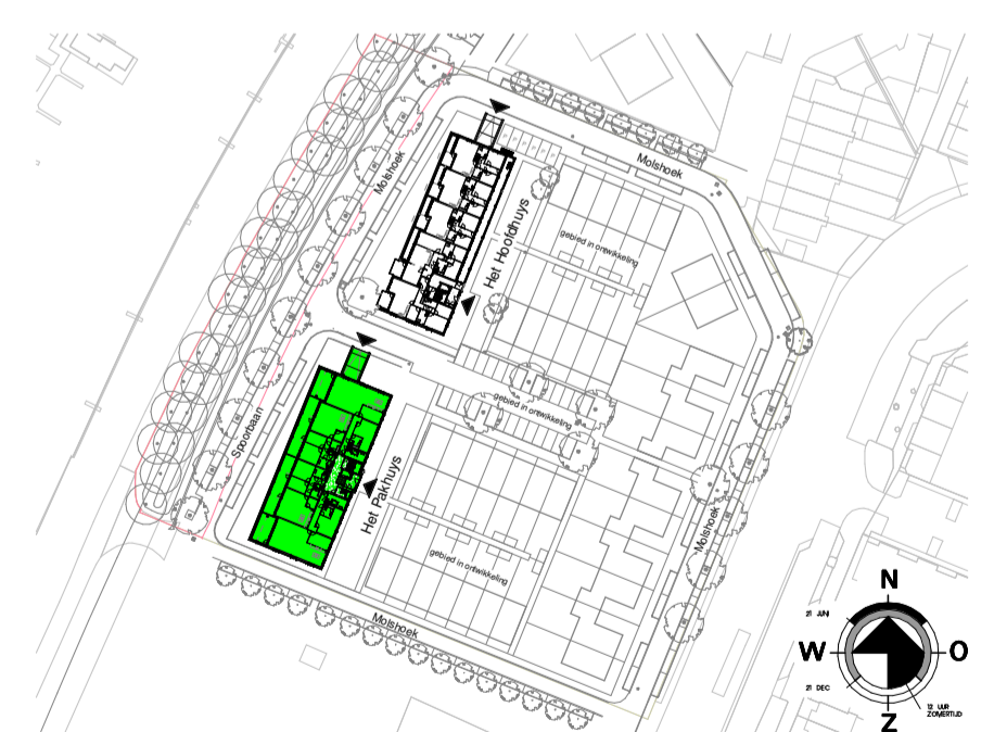
Situatie schaal 1:1000